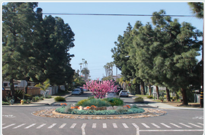
* This illustration does not represent the Roosevelt Street and Oak Avenue site