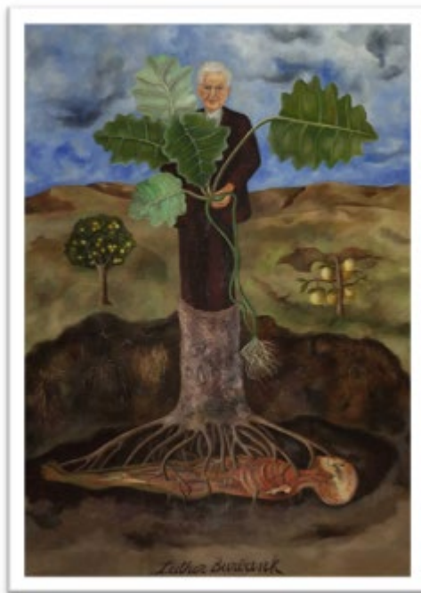
Retrato de Luther Burbank, Frida Kahlo, 1931, óleo sobre masonita

Obra de arte de inspiración - ENTENDIENDO LOS MUNDOS DEL ARTE; Aprendiendo sobre lo que hacen los artistas.